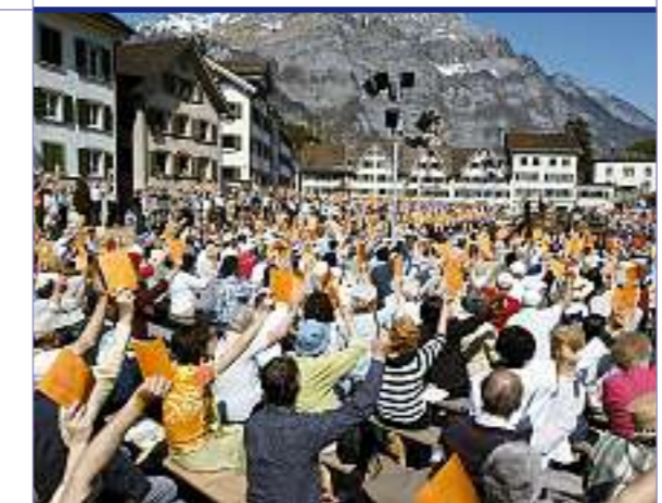
Die Landsgemeinde, eine der ältesten und einfachsten Formen direkter Demokratie.