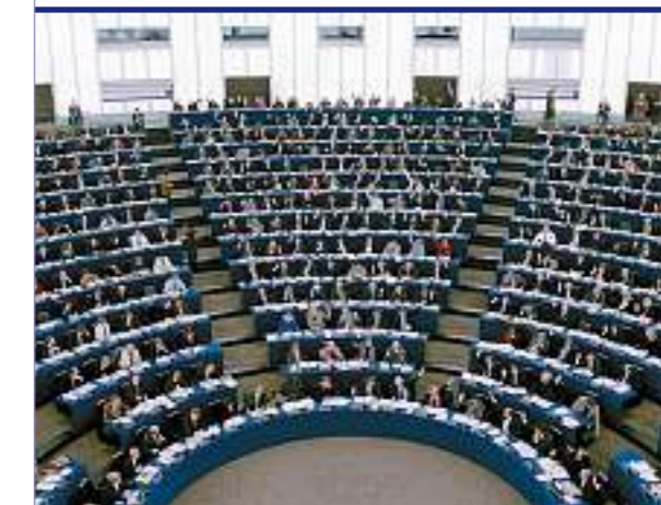
Sitzung der 732 Abgeordneten des Europäischen Parlaments in Strassburg.

Demokratie kann sich durch verschiedene Staatsformen in den einzelnen Ländern unterscheiden. In einer direkten Demokratie entscheidet das Volk durch Abstimmungen. In einer repräsentativen oder indirekten Demokratie wählt das Volk Vertreter (Abgeordnete, Parlamentarier), die dann an seiner