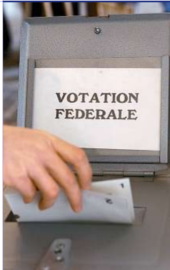
Jährlich zwei- bis viermal entscheidet das Schweizer Volk an der Urne über Referenden und Initiativen.

Änderungen der Bundesverfassung sowie Vorlagen, die den Beitritt zu einer supranationalen Gemeinschaft (bspw. die EU) oder zu einer Organisation für kollektive Sicherheit (bspw. die NATO) zum Ziel haben, werden in der Schweiz immer zur Abstimmung unterbreitet (sogenanntes obligatorisches Staatsvertragsreferendum). Dabei müssen