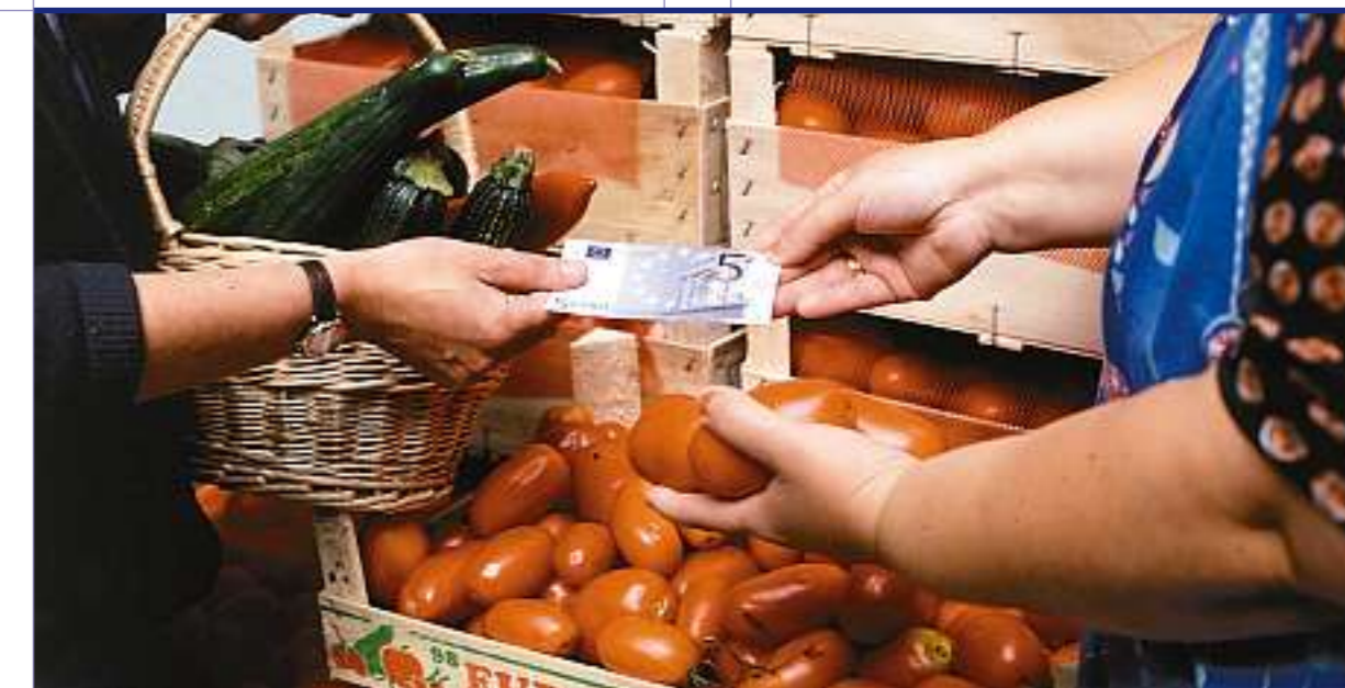
Seit 2002 wird in zwölf EU-Staaten mit der Einheitswährung Euro bezahlt. Auch die neuen EU-Länder werden, sobald sie die Kriterien erfüllen, ihre Landeswährungen durch ihn ersetzen.

Die inzwischen auf zwölf Länder angewachsene EWG – die heute Europäische Union heisst – beschloss darin, den gemeinsamen Markt der EWG zu vollenden, d.h. die gegenseitigen Handelsbarrieren im Warenhandel bis 1993 abzubauen und auch die Arbeitsmärkte sowie die Dienstleistungs- und Finanzmärkte zu öffnen. Somit entstand der Europäische Binnenmarkt, in dem Personen, Waren, Dienstleistungen und Kapital frei verkehren können.