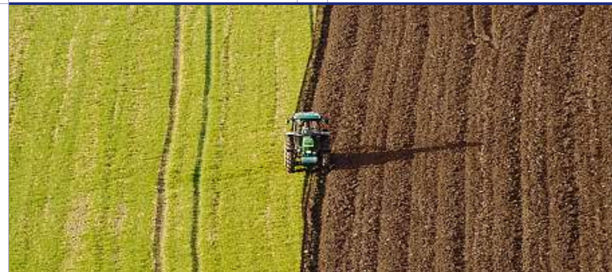
Landwirtschaft in der EU: Noch immer verschlingt die Landwirtschaft mit rund 40 Mrd. Euro pro Jahr den grössten Anteil des Budgets.

Die zunehmenden Überschüsse bei gleichzeitig stagnierender oder sogar abnehmender Nachfrage führten dazu, dass die Kosten für die Gemeinsame Agrarpolitik schnell anstiegen. Ausserdem führte die zunehmende Belastung der Umwelt, durchschnittlich hohe Konsumentenpreise und Tierseuchen europaweit dazu, dass sich seit Mitte der 1980er-Jahren vermehrt Kritik an der GAP breit machte. Gleichzeitig geriet die gemeinsame Marktordnung der GAP auch von aussen – vor allem durch die Welthandelsorganisation (WTO) – immer mehr unter Druck.